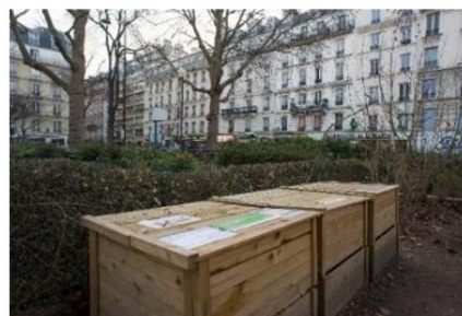
Zone de compostage

« Ces résultats témoignent d'un véritable changement de perception dans la gestion des espaces verts en milieu urbain : les déchets verts ne sont plus "subis" mais considérés comme une matière s'intégrant au sein d'un processus global de traitement et de valorisation de la matière organique. » conclut Catherine Muller, Présidente de l'Unep.