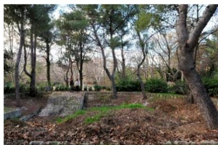
Aire de compostage

Les villes de l'observatoire ont donc fait le choix de « filières vertes » circulaires très intégrées, en privilégiant la réinjection des déchets verts dans le circuit d'entretien et d'aménagement paysager, plutôt qu'en misant sur l'exploitation énergétique.